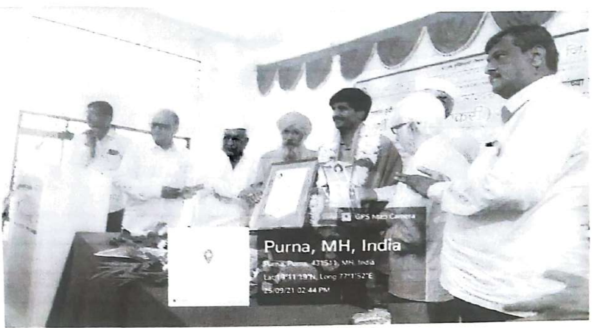
Panjab Dakh being Felicitated